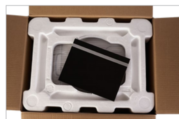
Díky přesným vnitřním rozměrům pasuje výrobek do balení správně