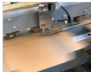
Nános změkčovací kapaliny SpeedUp na ohybovou hranu